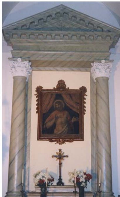
Tela dell'altare "Theatrum passionis Christi"