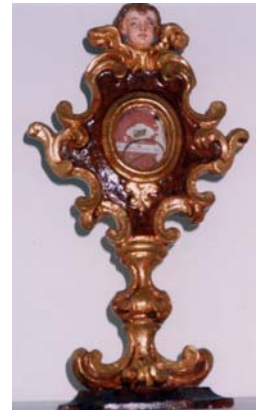
Ostensori con reliquie dei Santi Snierina e Magno