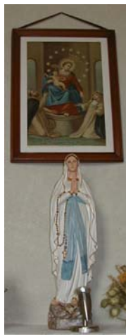
Madonna del Rosario Immacolata