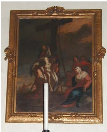
La deposizione di Gesù