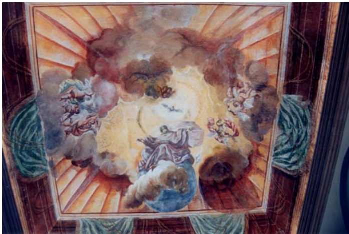
Affresco della volta: L'Empireo