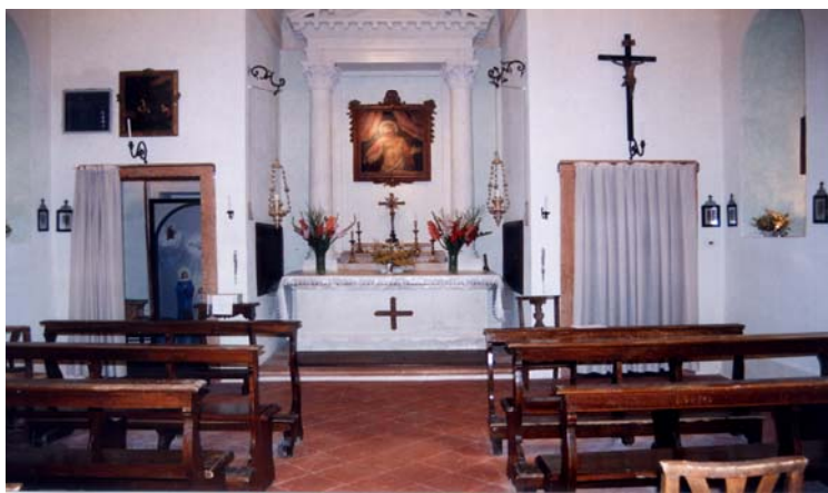
Interno della chiesetta, restaurata nel 2001