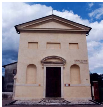
Prospetto dell'Oratorio del Redentore