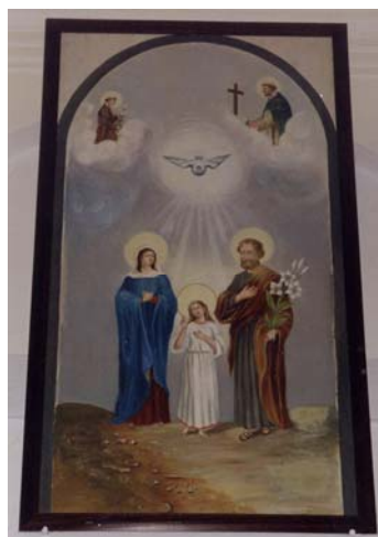
La Sacra Famiglia