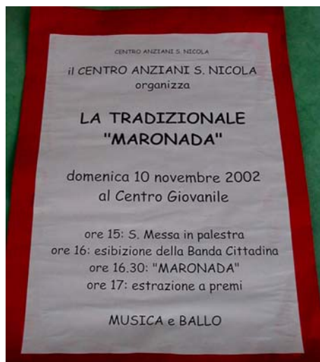
Il manifesto per la tradizionale "Maronada"