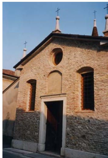
Esterno della Chiesetta di S. Nicola