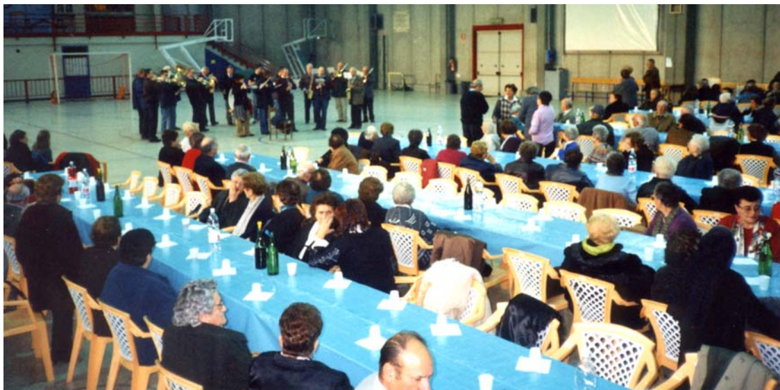
Anziani e loro familiari ascoltano la bella musica della Banda e pregustano i buoni “maroni” arrosto.