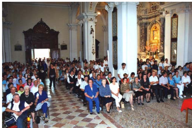
IL COMMOSSO INTERVENTO DELL'ARCIPRETE LA GRANDE PARTECIPAZIONE DEI FEDELI