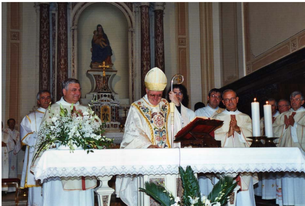
CELEBRAZIONE DELLA S. MESSA